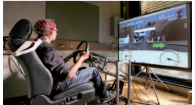
Le simulateur BCI pour la conduite.