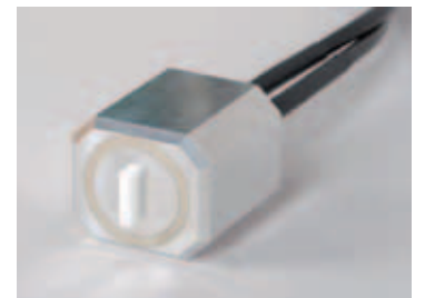
Gros plan sur Twilite, le tout nouveau dispositif de prélèvement sanguin à haute sensibilité de SwissTrace.

niveau de sensibilité et de linéarité, et présente un remarquable rapport signal/bruit. Pour affiner la précision d'un diagnostic, la TEP est souvent combinée aux scanners à résonance magnétique nucléaire (RMN). Cependant, l'imagerie par résonance magnétique nécessite un champ magnétique puissant et élevé rendant ainsi la plupart des appareils électroniques inutilisables. Twilite, qui, de par sa conception unique, est insensible aux champs magnétiques, est l'instrument idéal pour un emploi avec les scanners RMN.