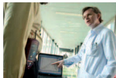
La courbe sur l'écran d'ordinateur montre au patient sa manière de se déplacer par rapport à sa zone à risque.

Muni de ces précieuses informations, les patients ajustent leurs pas pour faire baisser la pression. L'idée est qu'ils marchent automatiquement, sans aucun effort supplémentaire de concentration. « Nos résultats montrent qu'ils arrivent à maintenir cette nouvelle façon de marcher pendant dix jours, annonce-t-il. Maintenant, il s'agit de prouver que cet apprentissage peut faire ses preuves à plus long terme, sur six mois à un an. »