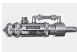
Système de pulvérisation pour peinture et granulats développé par Kamber SA