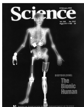
Un organe artificiel permet de vivre mieux plus longtemps

(Record d'efficacité pour les cellules solaires à colorant)